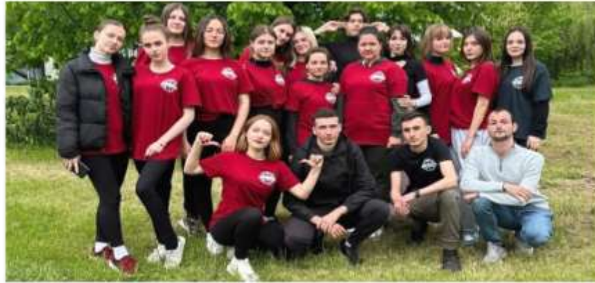
Студенческий слет «Наш дом- ЭКОНОМ»